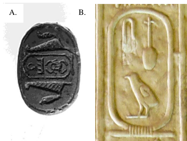
A. Skarabeusz III. Thutmoszisz nevével, Szépművészeti Múzeum B. Sznofru neve kartusban az abüdoszi I. Széti templom királylistáján

Ugyanezen papirusz töredéken korábban is szerepel csomó (B.12-14). Ott különböző – hiányosan megmaradt – anyagok összekeverése után kapta meg immár a gyermek vagy felnőtt a mindkét szívformáját (ib és khati) védő megcsomózott lenszálat.