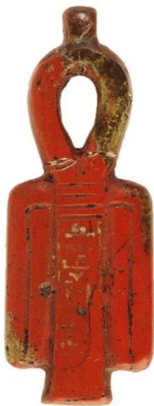
Ízisz csomó amulett, Szépművészeti Múzeum

dósult eredménye a sen -karika és a királyok nevét övező kartus. A képzet a királykultuszban a 4. dinasztia elejére erősödött annyira meg, hogy a kartus a titulátúra részévé vált. Sznofru fáraó több nevét már ezzel a névgyűrűvel vették körbe (Hórusz neve még a szereh -ben olvasható). A név mágikus védelme rendkívül fontos volt, hiszen elképzelésük szerint annak birtokában a varázslat segítségével viselője felett hatalmat lehetett gyakorolni. Persze pozitív értelemben is felhasználható volt ez a hatalom, hiszen azért írták fel a sír bejáratánál a halottak nevét és életét, hogy az arra járók ejtsék ki, és ezzel fennmaradásukat segítsék elő. Egy másik hasonló mágikus felhasználás, amikor a pecsételő skarabeuszok aljára kartusba írt királynevet véstek – III. Thutmoszisz fáraó Men-Kheper-Ré neve halála után is hosszú ideig készült a mágikus pecsételőkön.