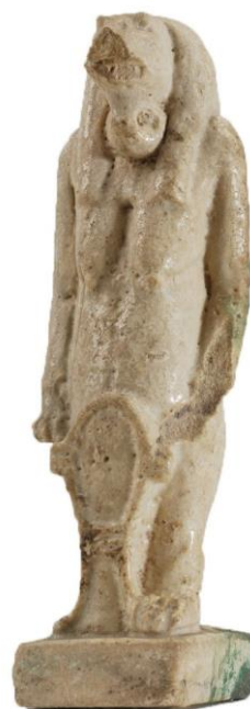
Toerisz istennő amulettje a védelem jelével maga előtt, Szépművészeti Múzeum

Mondd a szavakat a matet-net-szut felett négyszer. Finom fonálból négy csomót csinálj. Olvastassék fel e varázsigé minden egyes csomó felett. Tétessék az ember fejére. Elpusztítja ama ellenséget, halottat, halott nőt, aki bántalmakat okoz a fejben vagy bármely tagban. Valóban jó, milliószor (kipróbált).”