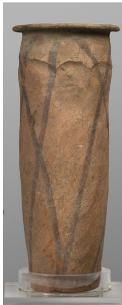
Hengeres edény hálómintával (Nagada kultúra), Szépművészeti Múzeum

Hosszú ideig hasonlóan népszerű volt az Ízisz csomó, ami Ízisz istennő védő erejét közvetítette viselője számára. A Halottak Könyve 156§ a következőképpen írja le, Kákósy László fordításában: „ Vörös jáspis tjet varázsigéje. XY, az igazhangú így szól: Tied a te véred, Ízisz. Tied a te varázserőd, Ízisz. Tied a te varázslatod, Ízisz,